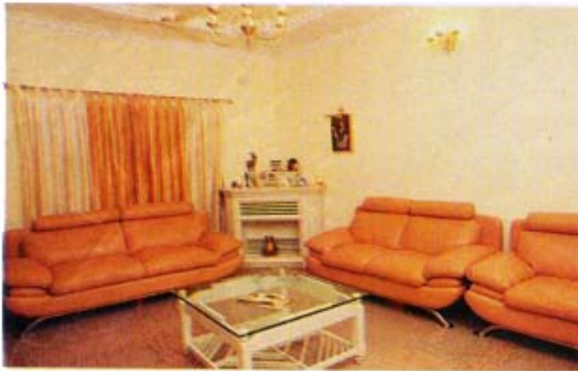
സമീപമാണമുനിയ്ക്ക് ഹാൾ പൂർണ്ണമായും മാതൃകയാക്കി അതിനു ഇതിൽ എഡി വിട്ടിട്ടുണ്ട്. (മുകളിൽ) വൈകിട്ട് ഹാളിലിരിക്കുന്നു. (താഴെ)

ൾ വരെ സുഖമായി വിശ്രമിച്ചിട്ടുണ്ട്. റോഡ് റോളർ ഉപയോഗിച്ചു നില നിർമ്മിക്കാൻ തുടങ്ങി. മൂന്ന് ഇഞ്ചുകനത്തിൽ മണ്ണു വിരിച്ച ശേഷമാണു പുല്ലു നട്ടത്. പുല്ലു മാത്രമല്ല 34 ഇനം പൂച്ചെടികളും ഇവിടെയുണ്ട്. ദിവസവും നൂറു ചിത്രശലഭങ്ങളെങ്കിലും ഇവിടെയെത്തുന്നു രണ്ട് ജീവിതത്തിന്റെ നിരീക്ഷണം. ജൈവവളം മാത്രമുപയോഗിച്ച് 'ഇക്കോ ഫ്രണ്ട് ലി' രീതിയിലാണു പുരോഗമനം പരിപാലിക്കുന്നത്.