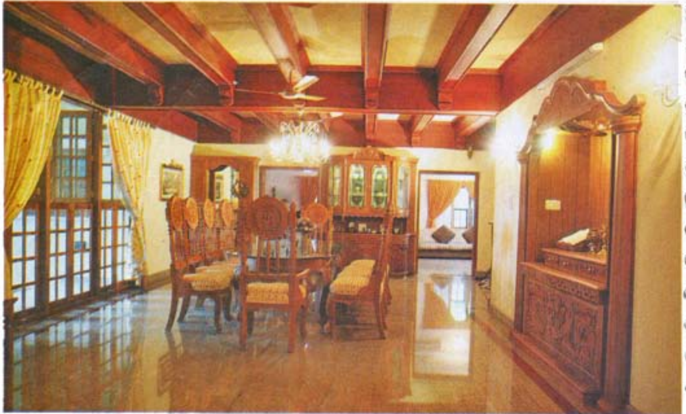
ഡൈനിംഗ് റൂം. ഇടതുവശത്തു നടുമുറ്റവും വലതുവശത്തു പ്രാർത്ഥനാ റെഫറേറ്റും (മുകളിൽ) ഗ്ലാസ് കൊണ്ടുള്ള ക്യൂരിയോ കബിനറ്റ്. (വലത്)

പ്ലം വാതിൽ തുറക്കാതെ പുറത്തു നിൽക്കുന്നവരെ കാണാം എന്ന പ്രയോജനവും ഇതു നൽകുന്നു. യൂറോപ്യൻ ശൈലിയിലാണു വീടിന്റെ പ്ലാൻ. സിറ്റ് ഔട്ടിൽ നിന്നും നേരെ എത്തുന്നതിന് ഫോയറിലേക്ക്. അതിന് ഇടതുവശത്തായി ലവിങ് റൂം. ഫോയറിൽ നിന്നു നേരെ പേയാൽ ഡൈനിംഗ് റൂം. ഡൈനിംഗിന് ഇടതുവശത്തായി മൂന്നു കിഷ്യൂചുറികൾ. വലതു ഭാഗത്തു ഫാമിലി ലിവിംഗ്, അടുക്കള, സ്മോൾ കൂടങ്ങിയവയും മുകളിൽ ഒരു ബെഡ് റൂം. ലിവിംഗ് റൂം, ബാൽക്കണി എന്നിവയാണുള്ളത്.